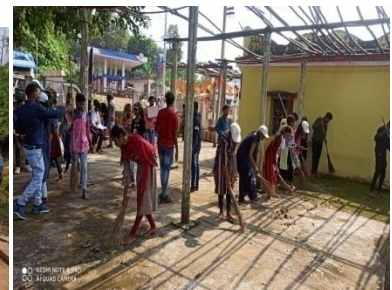
स्वच्छता (मंदिर परिसर)