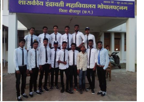
मिस एवं मिस्टर फेरवेलवार्षिक उत्सव महाविद्यालय छात्र संगठन