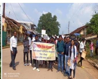
स्वच्छता अभियान रैली