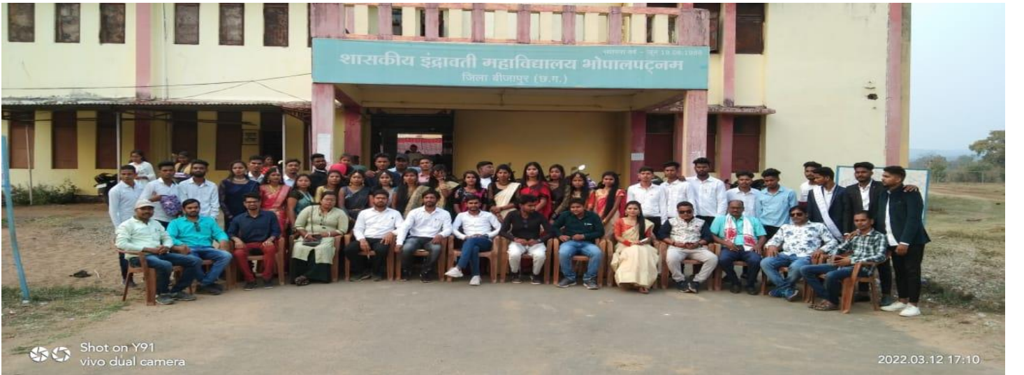
महाविद्यालय के वार्षिक स्नेह सम्मेलन 2020-21 अंतिम वर्ष समस्त छात्र-छात्राओं, शिक्षकगण एवं महाविद्यालय परिवार