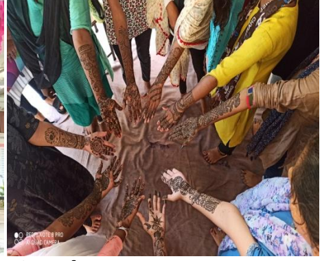
आयुर्वेदिक शिविर का आयोजन एन.एस.एस. दिवस पर कार्यक्रम महाविद्यालय में मेंहदी कार्यक्रम