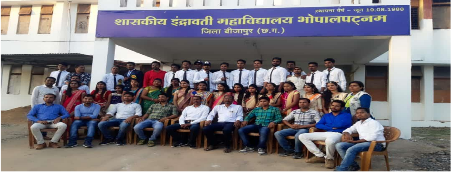
महाविद्यालय वार्षिक उत्सव समारोह 2019-20 छात्र-छात्राओं, शिक्षकगण एवं समस्त अतिथिगण