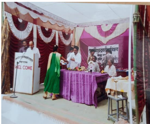
वार्षिकोत्सव पुरस्कार वितरण में चयनित महाविद्यालय की छात्राएं