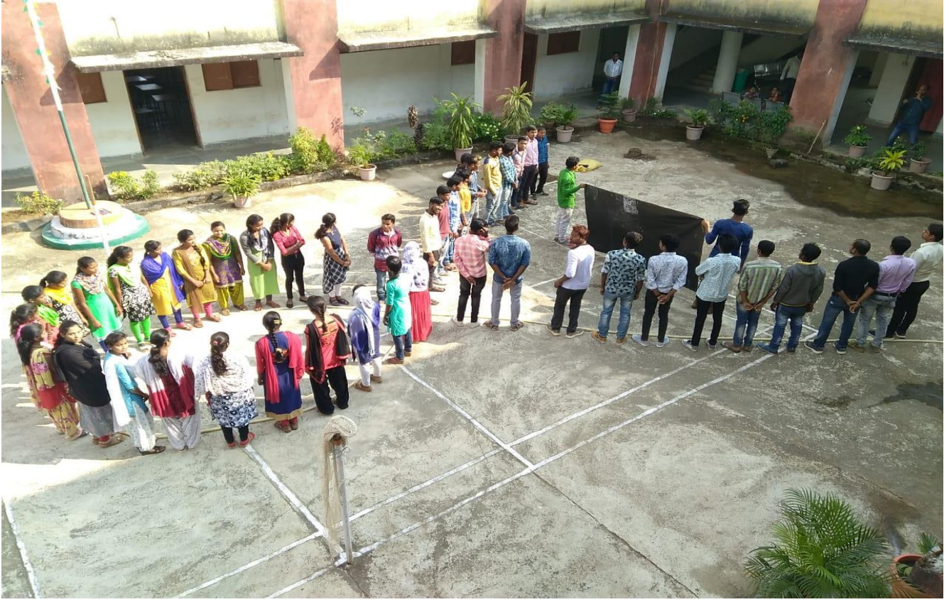
कार्यक्रम के माध्यम से एड्स की जानकारी