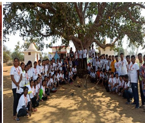
राज्यस्तरीय एन.एस.एस. शिविर क्राईम विषय पर शिविर का आयोजन