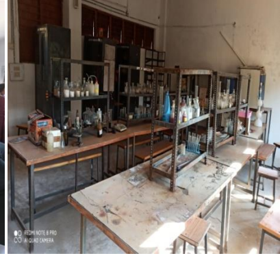
रसायन विज्ञान प्रयोगशाला