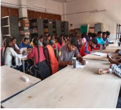
जन्तु विज्ञान प्रयोगशाला