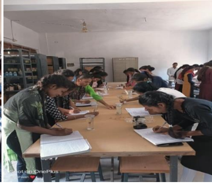
वनस्पति विज्ञान प्रयोगशाला