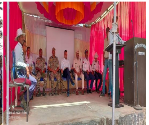
यातायात, महिला जागरूकता, साईबर