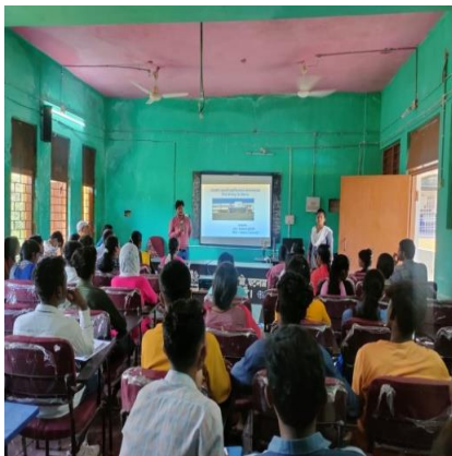
ई- क्लॉस रूम