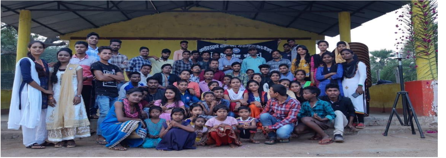
सात दिवसीय एन. एस. एस. शिविर के समापन समारोह की झलक