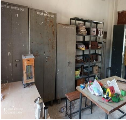
भौतिक विज्ञान प्रयोगशाला